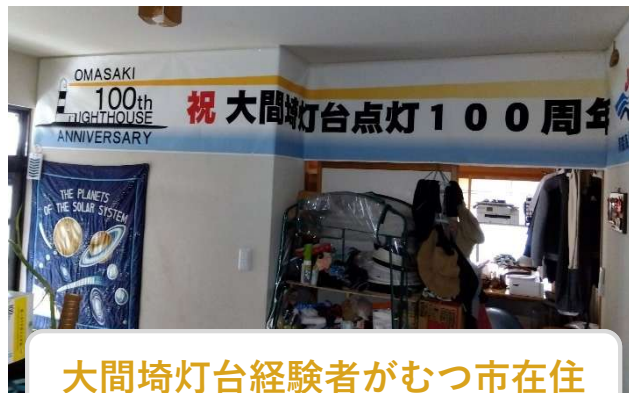
大間崎灯台経験者がむつ市在住