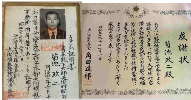
灯台を支えた町民の存在