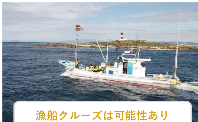
漁船クルーズは可能性あり