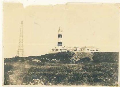
初代の大間埼灯台