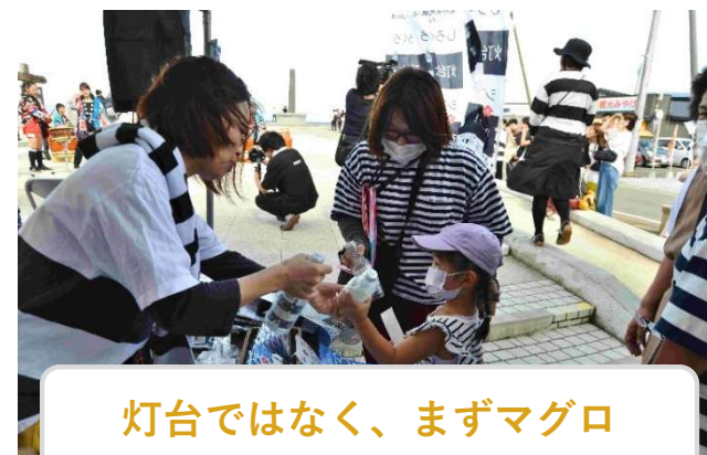
灯台ではなく、まずマグロ