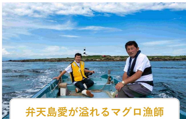
弁天島愛が溢れるマグロ漁師