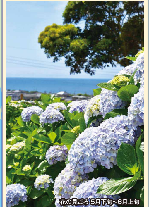
花の見ごろ 5月下旬~6月上旬

地球の丸く見える丘展望館では、地元ボランティア団体の「友愛会」さんが草刈りや花植え、草木の剪定をしています。遊歩道を歩くと大玉やハート型のアジサイを楽しむことができます。展望館下のふれあい広場を含め全体で大小約300株ほどのアジサイは毎年観光客や市民の目を楽しませています。