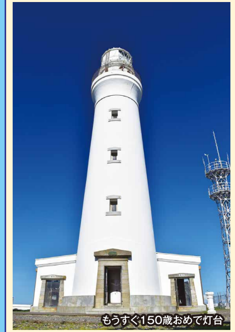
もうすぐ150歳おめでとう

明治7年11月15日の初点灯からもうすぐ150周年を迎える、国産レンガ19万3000枚を積み上げて建設された西洋式灯台。国の重要文化財にも指定されており、99段のらせん階段を登ると関東最東端から見える絶景が広がります。