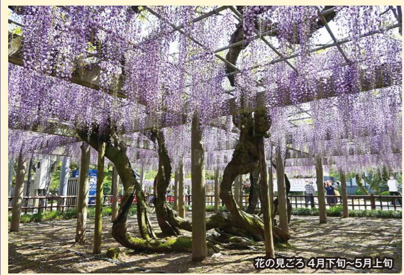
花の見ごろ 4月下旬~5月上旬

樹齢約800年といわれる大木は龍が横たわっているように見えることから「臥龍の藤」と呼ばれています。妙福寺の藤は、毎年4月上旬から開花しはじめ、下旬になると房が1.8m近くある見事な藤が満開になります。5月上旬から中旬にかけて開催される藤まつりでは、夜間のライトアップもあり昼間とは違った景観を楽しむことができます。