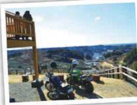
あささわふる里公園の展望台から